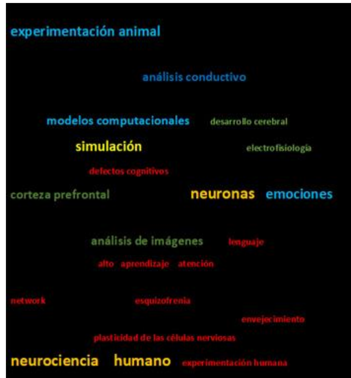
Fig. 3 - Palabras clave más representativas en las publicaciones de neurociencias.

En la figura 4 se proyectan los temas más estudiados en el campo de la neurociencia a nivel mundial, dentro de los que se destacan: neurociencia celular, estudios en vivo, investigaciones efectuadas en humanos y en animales, trabajos de memoria, reconocimiento facial, artículos clínicos, neurociencias computacionales, entre otros.